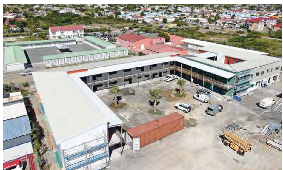
Vue aérienne du collège La Roche Gravée de Moho de Quartier d'Orléans en cours de construction.

Estimés au départ pour un montant total de 21M€, le budget total de cette construction caracolera à 34M€. Des écarts importants dus à