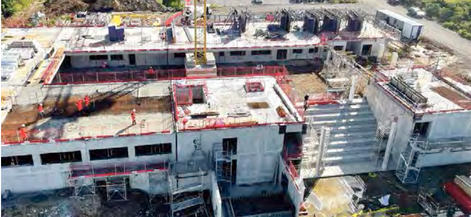
Le 1er bâtiment du collège 900 à la Savane est sorti de terre.

Le préfet Vincent Berton réunissait la presse hier matin pour faire un point d'étape sur l'avancement des travaux des plus importants chantiers de constructions de projets structurants en cours sur le territoire : les collèges 600 de Quartier d'Orléans et 900 de la Savane. Le premier devrait être livré pour la rentrée 2025, quant au second, il faudra probablement attendre le mois de janvier 2026 pour une réception complète des travaux.